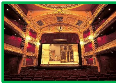
Andare a teatro