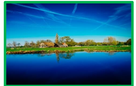
Andare in campagna