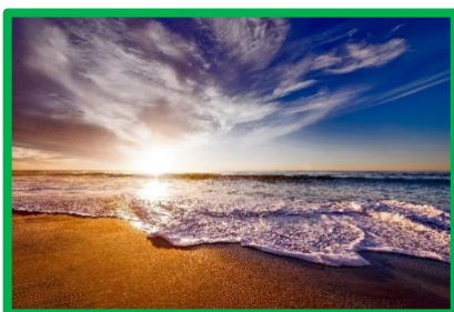
Andare al mare