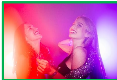
Andare a ballare