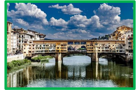
Andare a Firenze