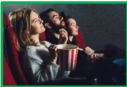
Andare al cinema