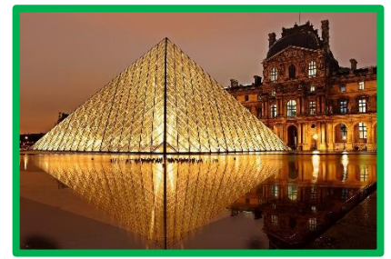
Andare in un museo