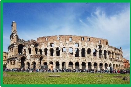
Andare in Italia