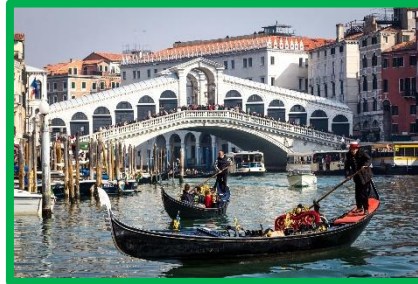
Andare a Venezia