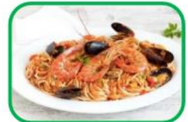
Gli spaghetti allo scoglio