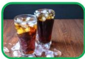
La bevanda gassata