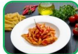
Le penne all'arrabbiata