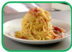
Gli spaghetti alla carbonara