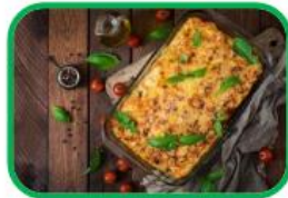
Le lasagne al ragù